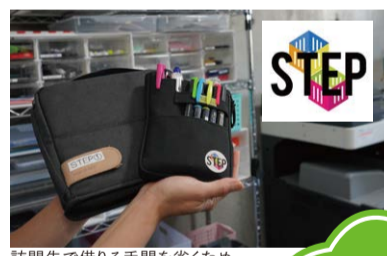
訪問先で借りる手間を省くため、事務用品も持参!